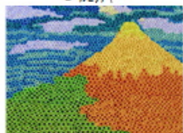
北斎「乱風快晴」 ロールピクチャー