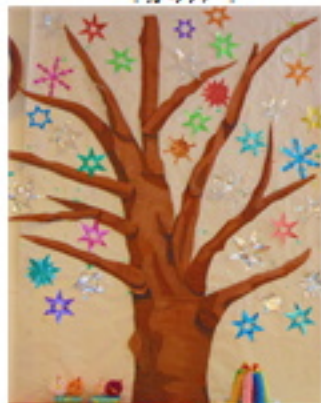
「ローズ・ファンタジー」 絵巻