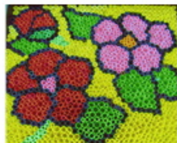
「IUBAKI」 ロールピクチャー