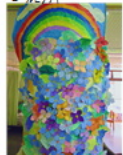
「にひる」 絵巻・ぬい巻