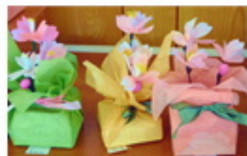
「世界にひとつだけの花たち」 牛乳パックアート